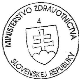
Viliam Čislák minister

Poučenie: Proti tomuto rozhodnutiu je možno podľa § 61 podľa ods.1 zákona č. 71/1967 Zb. o správnom konaní (správny poriadok) v znení neskorších predpisov podať rozklad v lehote do 15 dní od jeho doručenia, a to na Ministerstvo zdravotníctva Slovenskej republiky, Limbová 2, 837 52 Bratislava. Toto rozhodnutie nie je preskúmateľné súdom podľa zákona č. 99/1963 Zb. Občiansky súdny poriadok v znení neskorších predpisov, pokiaľ nebol vyčerpaný riadny opravný prostriedok.